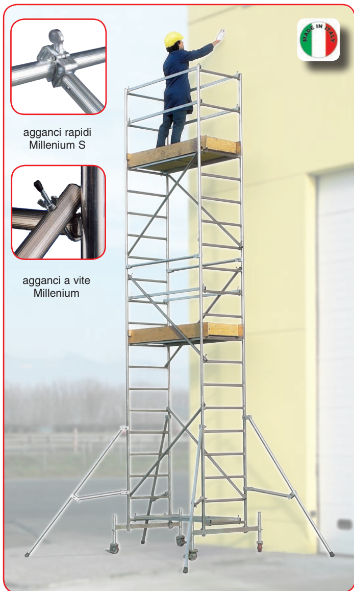
agganci rapidi Millenium S