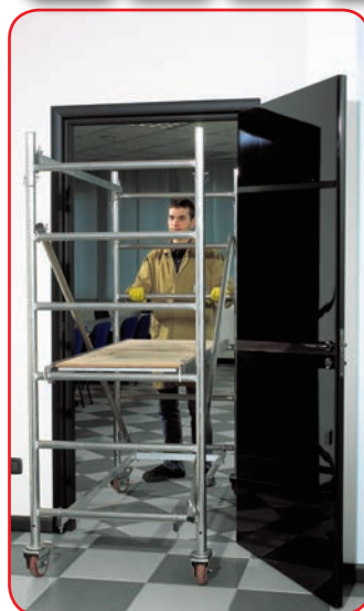
Passa attraverso porte standard