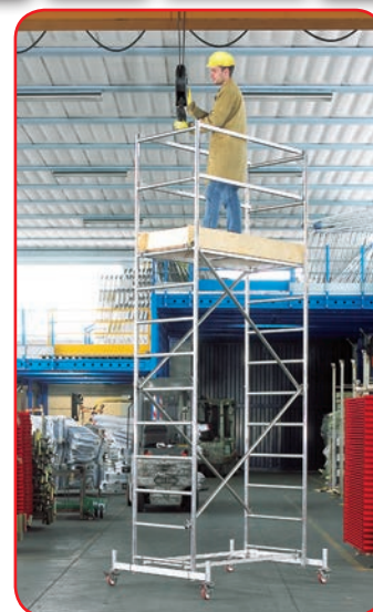
Millenium® m 4,08 (Moduli A+B)