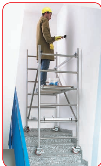
Modulo A zoppo su scale