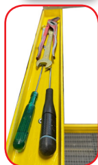
Nuova vaschetta portattrezzi