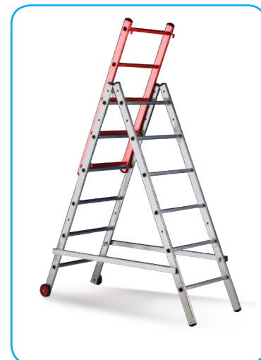
Mago con prolunga optional (posizione a scala con guardacorpo)