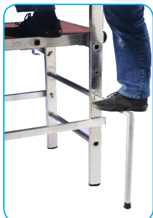
Piolo estraibile per la salita comoda dell'operatore