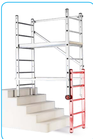
Mago con prolunga optional per scalinate (posizione a trabattello)