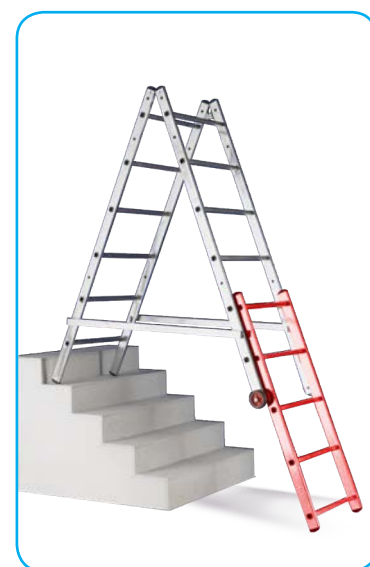
Mago con prolunga optional per scalinate (posizione a scala)