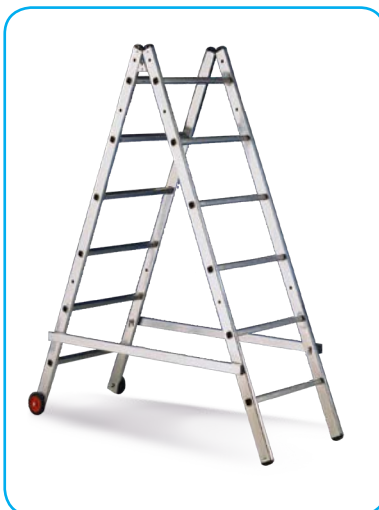
Mago trasformato in scala doppia