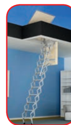
Per Terrazzi m 3,00