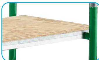
Piano in legno con armatura in alluminio