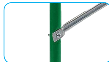
Viti di fissaggio traverse