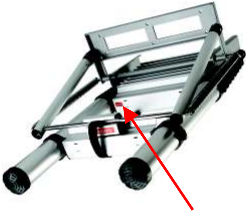
pulsanti per chiusura scala

Le scale a soffietto tradizionali sono economiche e facili da montare ma sacrificano il comfort e la stabilità. Le scale snodabili tradizionali sono molto stabili e confortevoli durante la salita ma più care e complicate da montare. LOFT combina una grande semplicità di montaggio con una stabilità ed un comfort di salita che non hanno uguali.