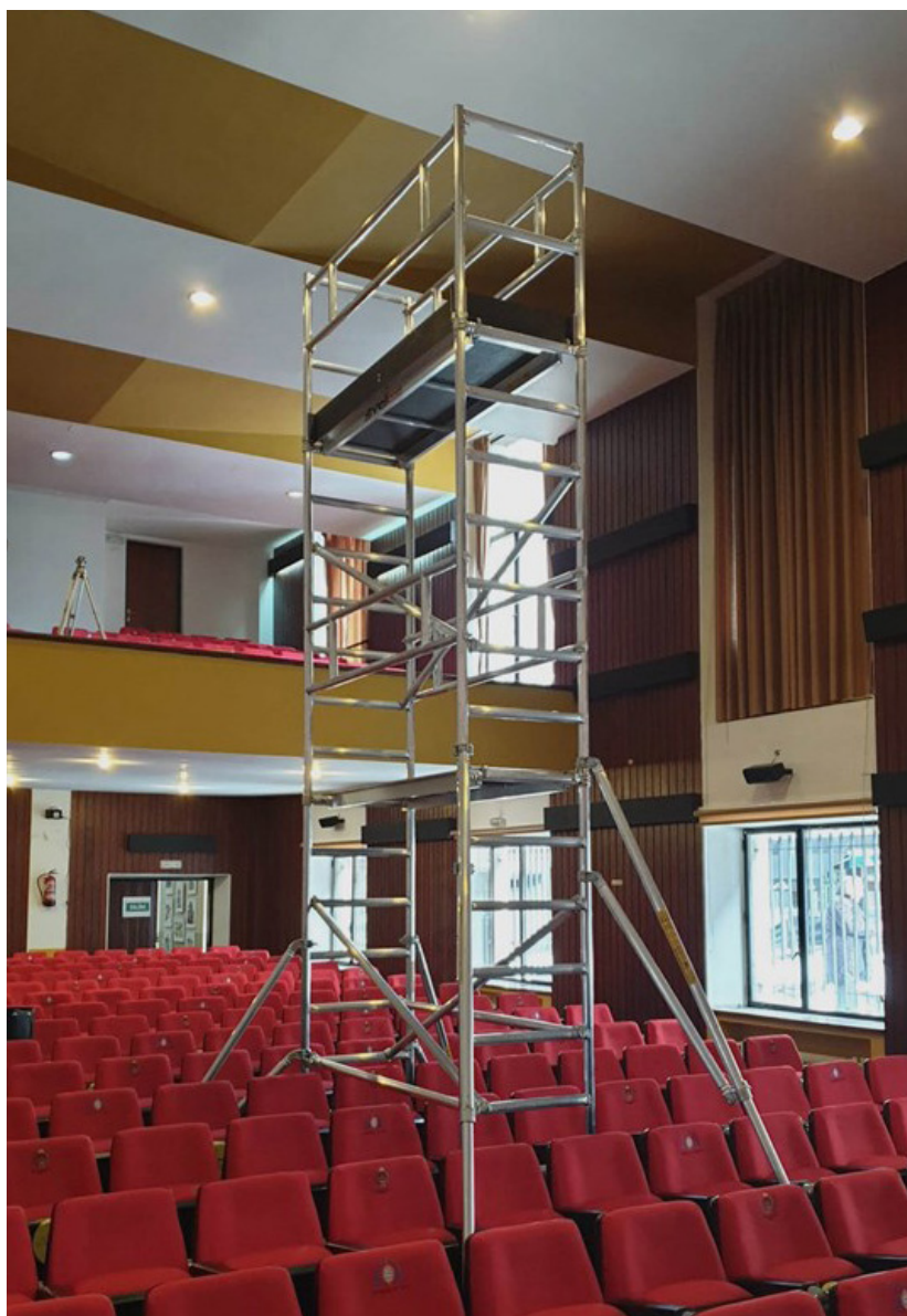
TEMPO ANFITEATRO EN PUESTO DE TRABAJO

TEMPO ANFITEATRO está diseñado para usarse en terrenos inclinados, escaleras, cines o anfiteatros. Su estructura permite salvar obstáculos como filas de sillas y trabajar con seguridad. Está fabricado en aleación de aluminio tubular ligera y resistente al óxido, con peldaños estriados antideslizantes. Sus pocos componentes lo hacen fácil de transportar, montar en minutos y sin necesidad de herramientas.