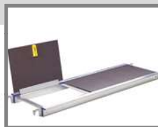
Plataforma con trampilla para acceder por el interior del andamio