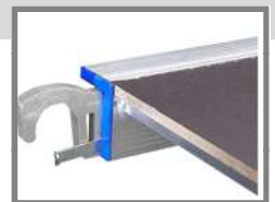
Ganchos antiviento en la plataforma