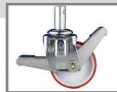
Ruedas equipadas con freno