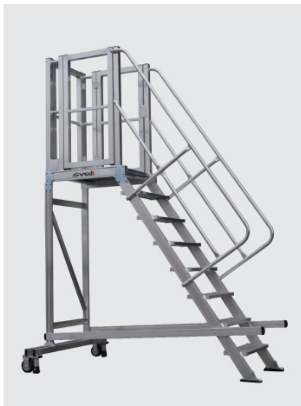
TORRETA CON TRIPLE PUERTA EN LA PLATAFORMA.