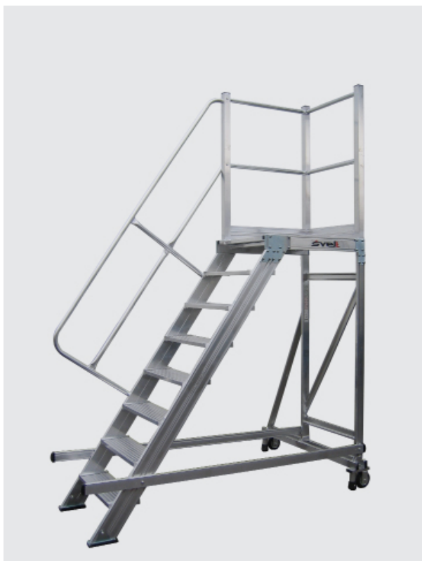
TORRETA CON SALIDA LATERAL.