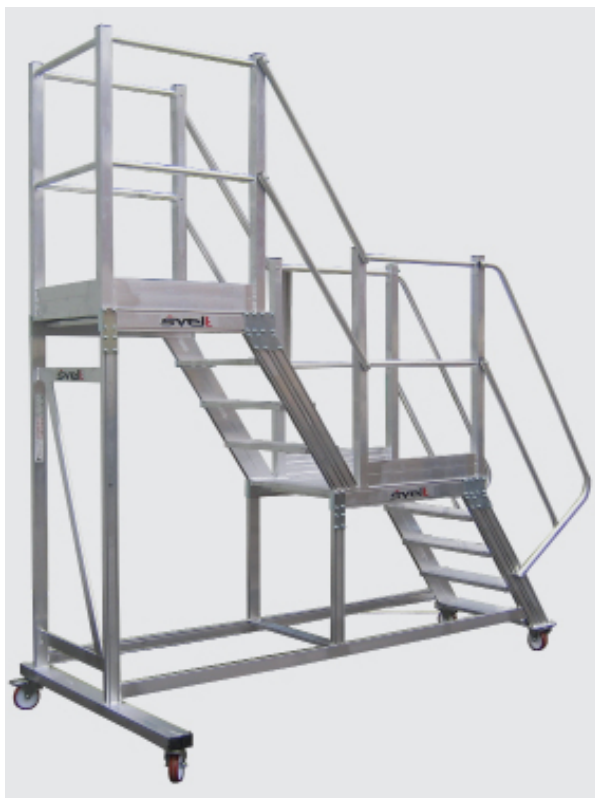
TORRETA CON DOBLE PLATAFORMA.