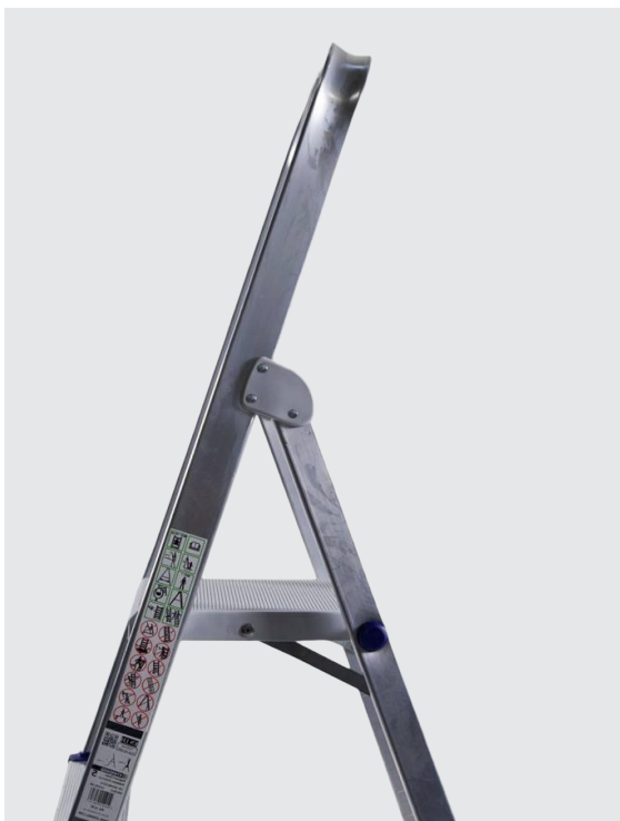
PUNTALES superficies terrosas (OPCIONAL)