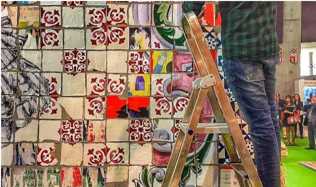
CASA aplicada al trabajo