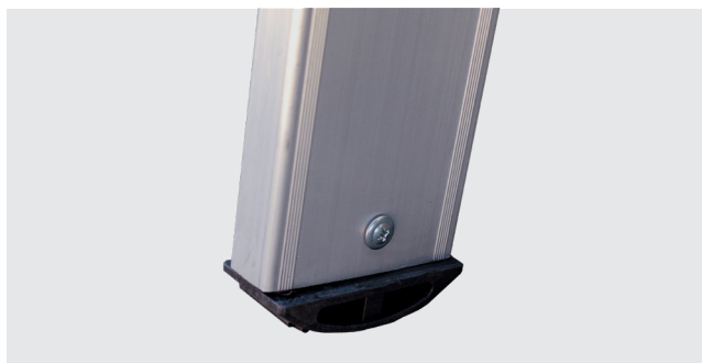
TACOS ANTIDESLIZANTES de PVC