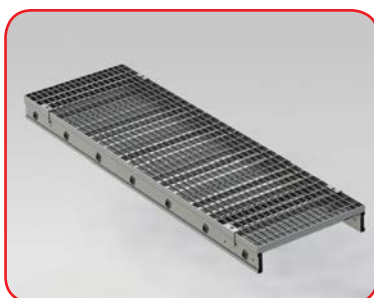
Piano grigliato drenante