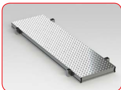
Piano pieno mandorlato