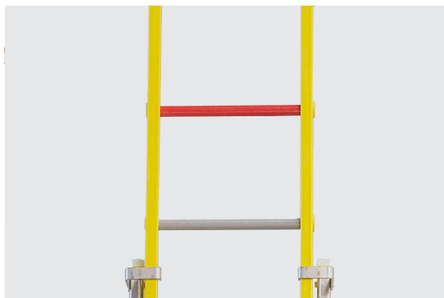
PELDAÑO ROJO para señalar último peldaño útil