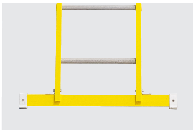
Incluye BARRA ESTABILIZADORA para su uso en apoyo

V2E es una escalera de fibra de vidrio de dos transformable para poder usarla tanto en tijera como en apoyo. Gracias a la fibra de vidrio, esta escalera es antimagnética, resistente a la humedad, los ácidos, la corrosión y los rayos ultravioletas.