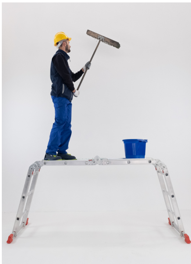
Uso como BANCO DE TRABAJO.