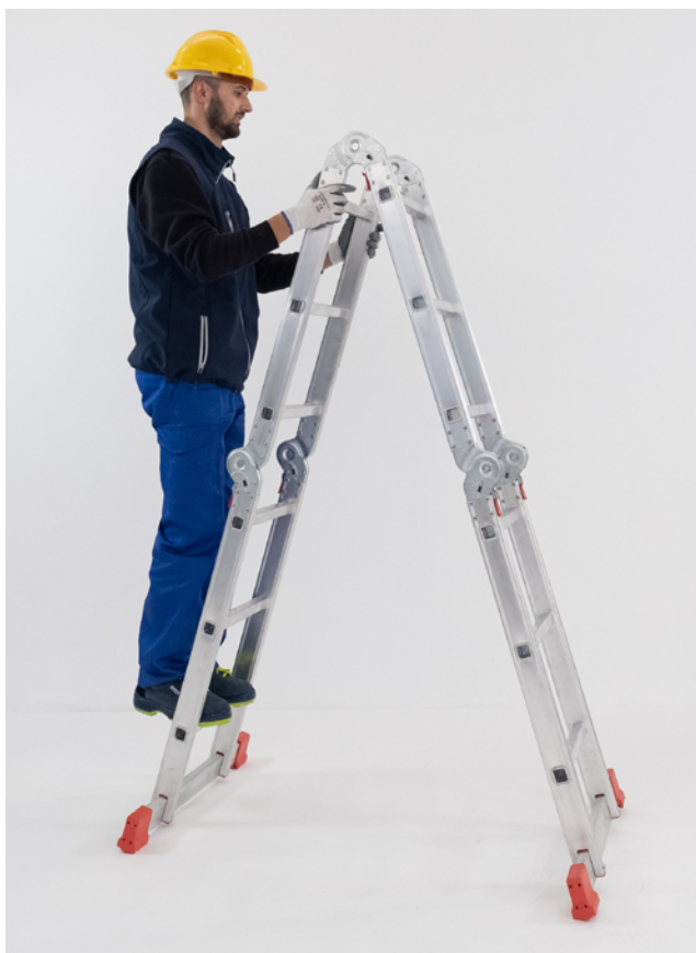
Uso EN TIJERA.