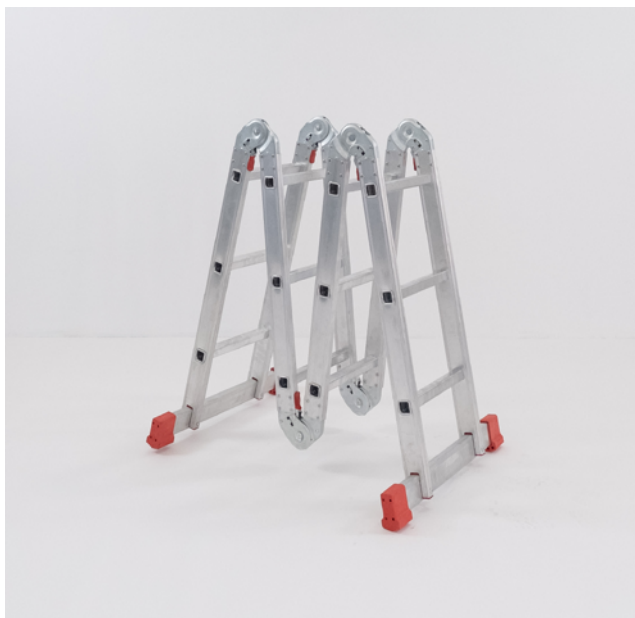
LADY PLUS plegada.