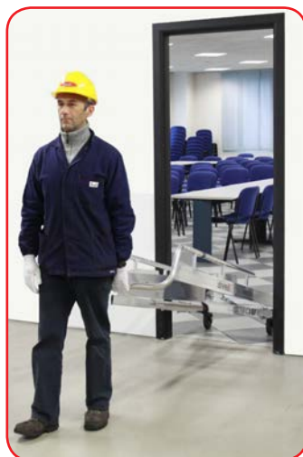
Facile da trasportare su ruote passa attraverso porte standard