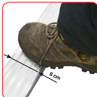
Gradini piani antisdrucchiolo