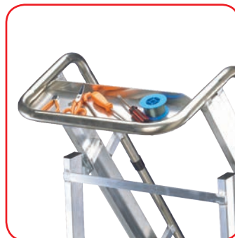
Vaschetta portattrezzi e portapacchi