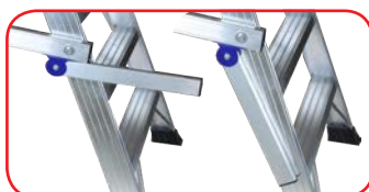
Maniglie ergonomiche chiudibili brevettate