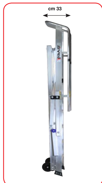
Chiusa ha ingombro molto ridotto