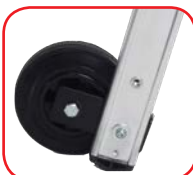
Rotelle di scorrimento Ø mm 150