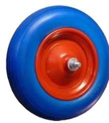
Ruota in poliuretano optional

1) Ruota a disco pneumatica (350x80 mm) con perno da 170 mm: Euro 16,50 cad. (Made in Italy)