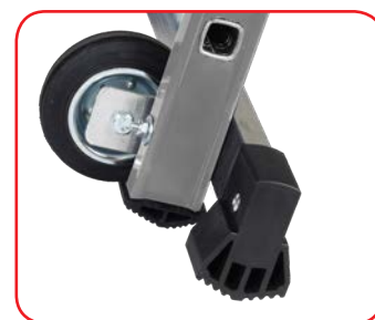
Ruota diam. 125 mm