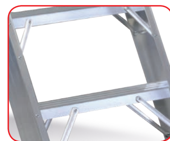
Rinforzi su tutti i gradini nei due lati