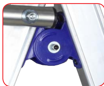
Cerniera maggiorata in acciaio