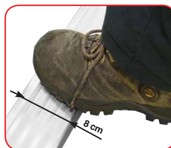
Gradino piano cm 8